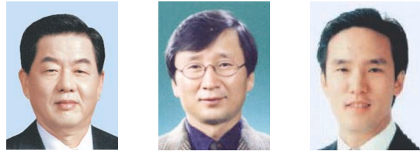
.( 가 )