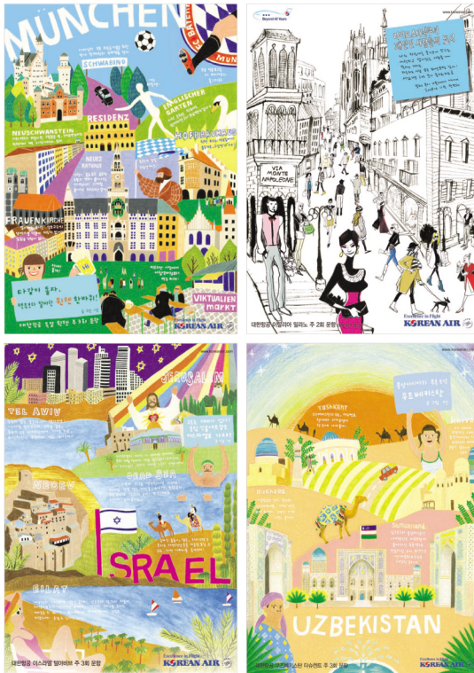
●광고주 : 대한항공 ●광고회사 : HS에드 ●광고명 : 일러스트 시리즈