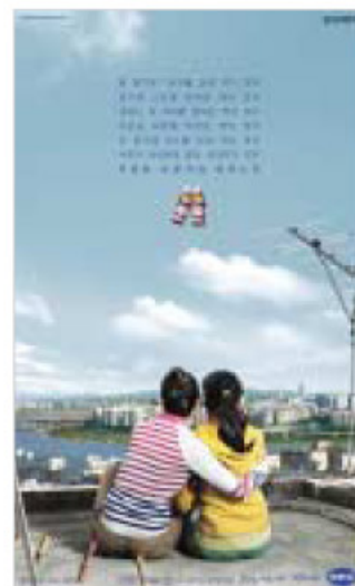
●광고주: 동아제약 ●광고회사: 제일기획 ●광고명: 누군가의 박카스