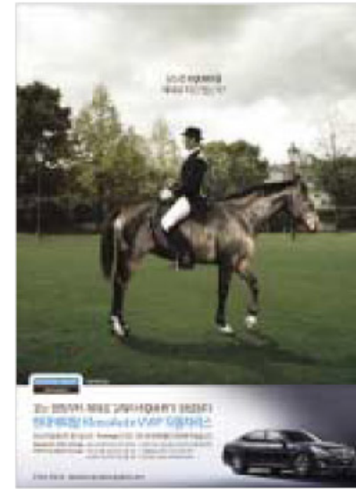
●광고주: 현대캐피탈 ●광고회사: TBWA KOREA ●광고명: 현대캐피탈 KlassAuto VIP 리스