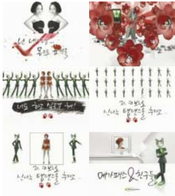
가 . ' 가 & ' .