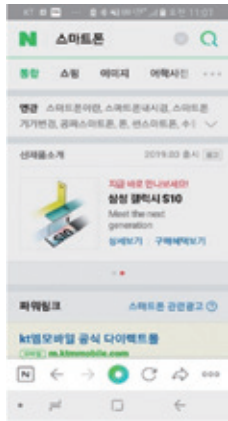
<그림 1> 네이버 모바일의 신제품 검색 예시