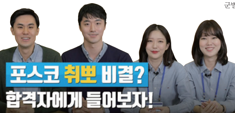
▼ 포스코의 유튜브 채널 랜선 멘토링 취뽀의 정석

LG전자와 삼성전자도 해당 직종 담당자 인터뷰나 직군별 입사 꿀팁 등의 콘텐츠를 통해 회사소개와 주요 인프라, 근무환경 등을 공개해 관심과 호응을 얻고 있다. KA A 이수지 susie@kaa.or.kr