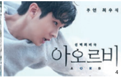
1 SSG닷컴의 광고 '쓱세권' 2 시코르×뷰티 유튜버 이사배의 메이크업 쇼 3 이순재를 모델로 한 자일리톨 광고 4 국내 최초 유튜브 인터랙티브 영화 '아오르비'