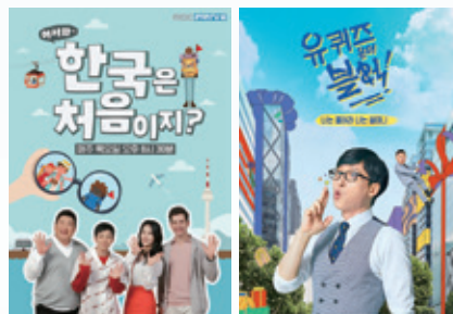
(좌) 어서와 한국은 처음이지 포스터와 (우)유퀴즈 온더 블럭 포스터

또 tvN '유퀴즈 온더 블럭'도 TTA에서 높은 경쟁력을 보였다. tvN '유퀴즈 온더 블럭'은 9월10일 본방송에서 시청률 2.8%(TNMS,유료가입), 시청자수 77만명으로 42위를 차지했지만 본방송 후 일주일간 TTA 집계에서는 시청자수 267만명을 확보하면서 6위로 36계단 꺾여 뛰어났다. 통합시청자 수(TTA)는 TNMS가 본방송뿐만 아니라 본방송 후 일주일간 동일 콘텐츠의 재방송, 그리고 VOD(KT올레TV+SK브로드밴드+LG유플러스+케이블 VOD)를 통해 시청한 시청자수를 모두 통합 집계한 데이터이다. KAA