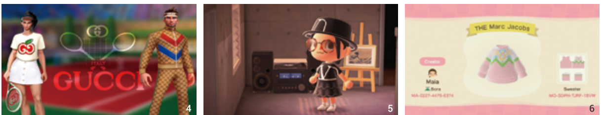
4 모바일 게임 '테니스클래스'와 협업한 구찌. 5, 6 닌텐도게임 '모여봐요 동물의 숲'에 캐릭터 의상을 배포한 발렌티노와 마크 제이콥스.