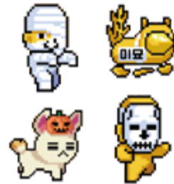
tvN 신서유기에서 론칭한 '신비한 용볼게임'과 게임 참여자들을 위한 경품 소개.

위해 게임 산업과 손잡은 것"이라며 "빅모델, 영상미 등을 내세우는 전형적인 광고보다는, 플레이 시간에 자연스럽게 브랜드를 노출해 친화도를 높일 수 있는 게임을 마케팅 톨로 선택한 것"이라고 분석했다.