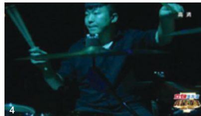
1~3 2015년 방통위가 제시한 협찬주명 방송프로그램 제목고지 예시. 4 중국판 ‘입백(Liby : 중국 로컬 액체세제 브랜드) 나는 가수다’. (2015년 방통위 제시)