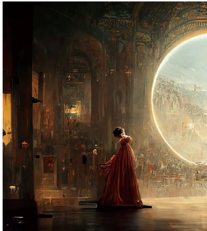
AI 미드저니(Midjourney) 작 'Space Opera Theater'

우리는 고차원적 사고와 추론까지 가능한 차세대 AI의 등장을 바로 앞두고 있는지도 모른다.