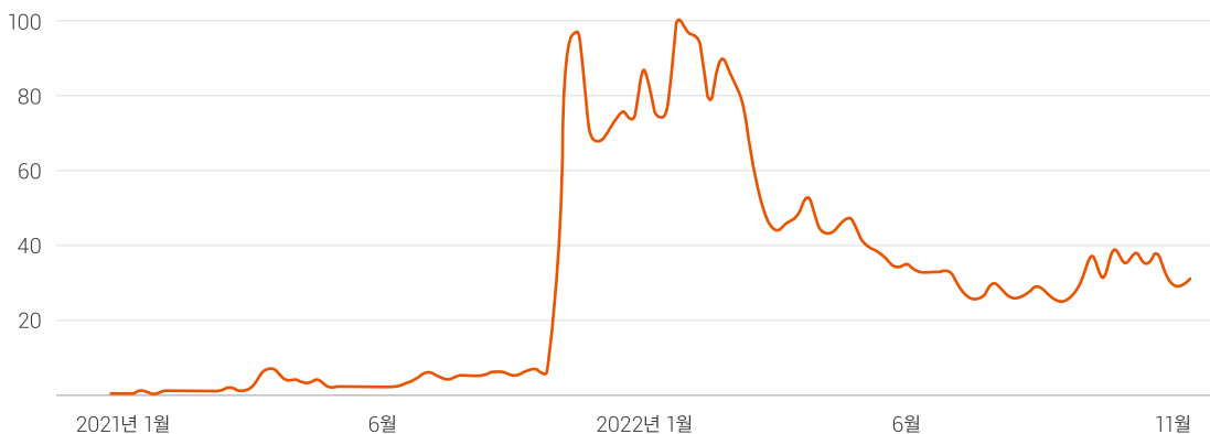
그림 11 | 메타버스 키워드 검색 추이(구글 트렌드, 2021.01~2022.11)

이처럼 메타버스 콘텐츠가 발전하면 미디어, 유통, 금융 등 새로운 산업과 접목하는 것이 수월해진다. 콘텐츠 범위가 여러 산업으로 확장함으로써 메타버스 시장의 규모는 급격하게 커지게 된다.