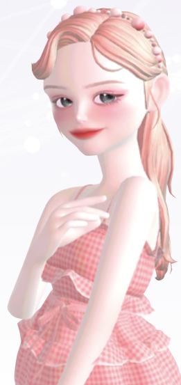
ZEPETO 렌지 크리에이터 인터뷰

2023년부터 구글, 애플, 소니 등 글로벌 테크 기업들이 준비해온 메타버스 디바이스가 순차적으로 출시된다. 15년 전, 스마트폰이 등장하면서 디지털 세계관이 확장되고 세상은 스마트폰으로 연결됐다. 메타버스 콘텐츠·경제·디바이스, 이 세 가지 요소가 온전히 결합한다면 다시 한번 새로운 세상, 새로운 시대가 열릴 것이다.