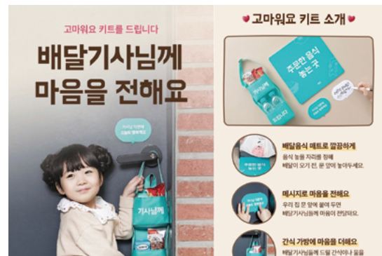
배달의 민족 ‘고마워요 키트’ 캠페인

작년 말, 카카오 먹통 사태 이후 플랫폼의 독점적 지위로 인한 폐해, 이른바 ‘플랫폼 갑질’ 이슈가 다시 수면 위로 올랐고 IT 업계뿐 아니라 산업계 전반에서 협력업체나 소상공인과의 불공정 이슈가 기업의 상생 위기로 지적받고 있다. 을의 위치에 있는 개인 및 조직과의 협력 과정에서 관행이란 이름으로 진행되어 왔던 계약 및 대금 지급, 의사 결정 프로세스 전반에 대해 재점검하면서 계속 을의 목소리에 귀 기울이는 노력도 병행되어야 한다. 기업 위기가 발생하면 대중들은 상대적 강자와 약자에 따라 가해자와 피해자로 인식하며 그에 따라 기업은 사실 여부와 상관없이 가해자로 보는 일종의 선입관이 발생한다. 이때 일관된 기업의 상생 활동이 긍정적 자산이 되어 까방권(까임방지권의 준말)의 역할을 할 수 있다.