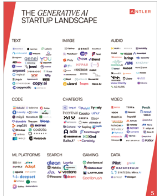
5 생성 AI 해외 스타트업 생태계

전문가들은 챗GPT 발 2차 서비스 혁명이 곧 시작될 것으로 예상한다. 인터넷 등장 이후 구글, 네이버, 유튜버가 나왔고 스마트폰이 개발된 후 쿠팡, 카카오톡, 인스타그램 등이 선보였듯이, 챗GPT 발 무수한 2차 서비스 기업들이 등장할 것으로 전망한다.