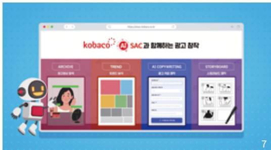
6 아이작 광고카피 서비스 화면 7 아이작 4개 서비스 화면

해당 스토리라인에 적합한 이미지를 스케치하여 비속련가도 손쉽게 아이디어를 스토리보드로 제작할 수 있게 해준다.