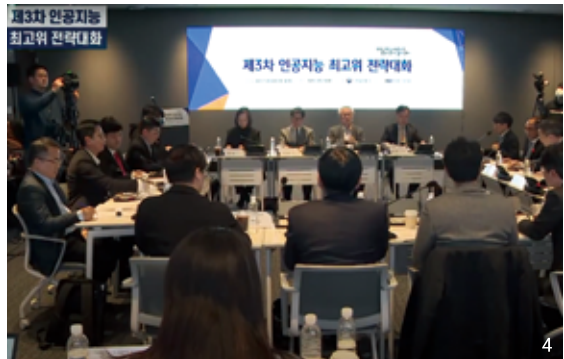
4 글로벌 빅테크 기업들의 초거대 AI 설명회와 한국의 제3차 인공지능 최고위 전략대회

미리 학습했다는 뜻이다. 트랜스포머는 구글이 만든 AI 언어모델 중 하나다. 챗GPT는 문자열을 대화체로 생성하는 AI인 것이다. GPT-3.5버전에 해당되는데 오픈AI는 3월 14일 업그레이드 버전인 GPT-4를 발표했다.