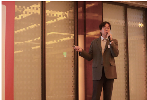
2023 한국광고주대회 현장 사진