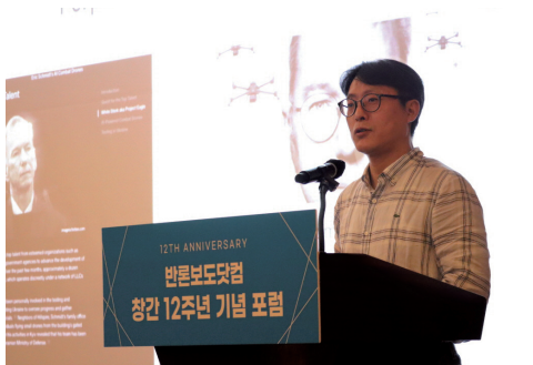
반론보도닷컴 창간 12주년 기념 포럼 사진