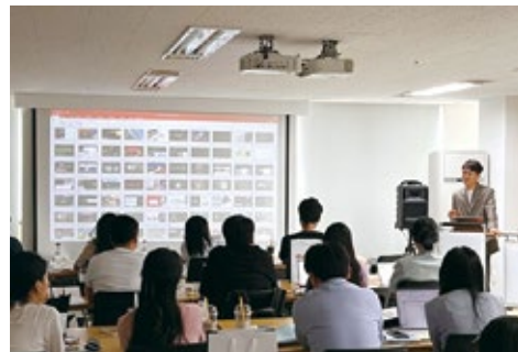
2023 광고&마케팅 전략워크숍 사진